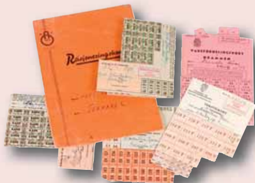
Rasjoneringsskort fra Hadeland.

Det kan være vanskelig å forstå at våre enkle liv kan få historisk interesse. Men historikere og andre fagfolk er stadig på jakt etter kildemateriale som kan belyse vanlige folks liv og tanker, som for eksempel dagbøker, brev eller husholdningsregnskap. Dette er materiale som blir mer interessant for hvert år som går.