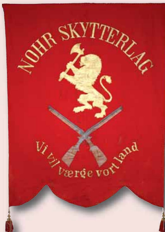
Nohr Skytterlags fane.