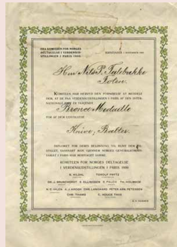
Nils Talebakkes diplom fra komiteen for Norges deltagelse i verdensutstillingen i Paris 1900.