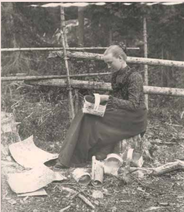
Ung kvinne fletter kurver.